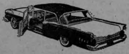
El Custom 300, tan novedoso como el Fairlane 500, y a un precio realmente económico. La eficiente y sencilla transmisión FORDOMATICA, es adaptable a motores en Seis o V-8.

El automóvil mejor proporcionado del mundo Usted se sentirá orgulloso de poseer un FORD 59, el carro elegante, práctico y económico a la vez. El FORD Fairlane 500 tiene una silueta semejante a la del famoso Thunderbird. Además, ningún carro lo iguala en economía. Sus potentísimos motores Seis o V-8, funcionan con gasolina ordinaria, y el nuevo filtro de aceite le economiza hasta un 75% en cambios de lubricante. FORD 59, el carro mejor proporcionado del mundo. Su Concesionario FORD Autorizado se lo mostrará gustoso.